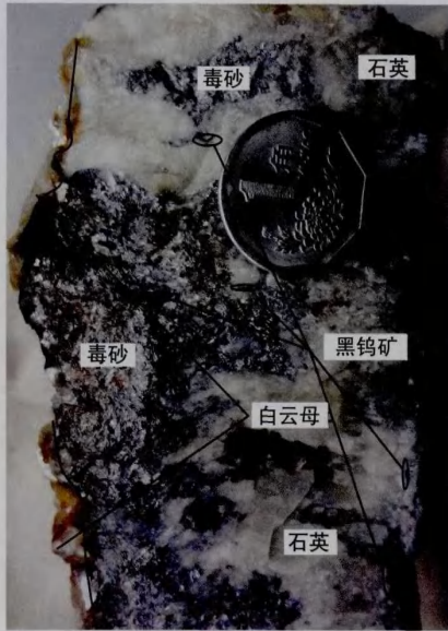
图2 水岩坝矿床280中段含钨石英脉