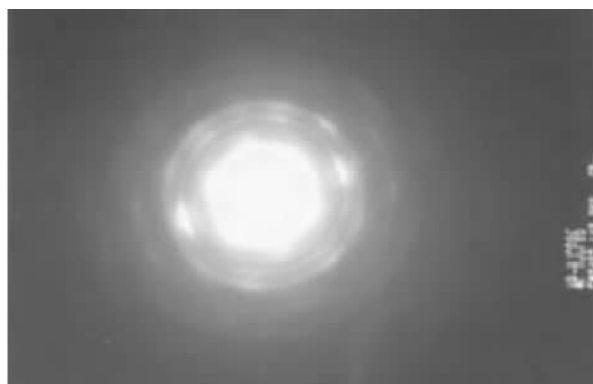
图 3 图 2 的透射电镜衍射图(中国科学院地球化学研究所刘世荣分析 样号 B-6)

Fig. 2 Transmission electron microscope (TEM) energy spectrum of otavite (sample B-6)