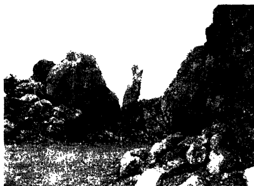
图 3 硅质岩重结晶后的菊花状石英岩 Fig. 3 Chrysanthemum-shaped quartzite after recrystallization of siliceous rocks

2) 稀土元素特征: 硅质岩的稀土元素特征和铈异常是区分热水沉积和非热水沉积的重要标志。海相热水沉积物稀土元素总量较低, 经北美页岩标准化后有负铈异常, 模式曲线近水平或向左倾 [12,13] 。本区硅质岩稀土元素模式向左倾或近水平, 硅质岩具有负铈异常( \delta\text{Ce} = 0.68 \sim 0.86 ), HREE 有富集趋势( \text{LREE}/\text{HREE} = 6.57 \sim 47.48 ; (\text{La}/\text{Yb})_N = 0.21 \sim 2.73 ), 具有热水沉积硅质岩的特征(表 1, 图 4)。此外, 通过硅质岩的稀土元素北美页岩标准化分布模式图可以估算出岩石中热水沉积与非热水沉积的比例, 模式曲线向左倾斜程度越高, 沉积岩中热水沉积物的比例就越大 [14] 。从图 4 中可以看出, 有三个样品明显左倾, 另三个则近水平, 说明本区硅质岩以热水沉积为主, 但也