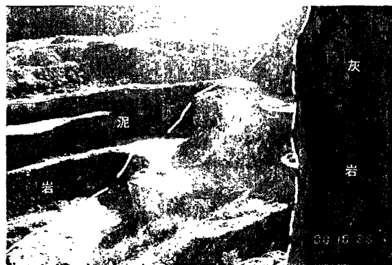
图1 高龙金矿区硅质岩与周围地层的接触关系

高龙金矿床位于田林县高龙乡。矿区位于桂西坳陷西林—百色断褶带中高龙水下隆起边缘,由鸡公岩、金龙山、龙爱三个矿段构成。矿区构造为不完整的背斜构造—穹隆构造,此穹隆系东面八渡背斜的西延部分,后被断层破坏所至 [1] 。穹隆长轴走向北西西,核部为水下隆起上二叠统碳酸盐岩,主要为生物碎屑灰岩,周围为三叠系砂、泥岩,三叠系下统以泥灰岩为主,三叠系中统为成熟度较高的并具鲍玛序列的浊积岩。隆起区紧靠碳酸盐岩的周围为一硅质岩带,金矿体产在该硅质岩带中及其紧邻的中三叠统百蓬组砂泥岩中(图1)。