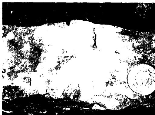
图 2 高龙金矿区硅质岩型矿石采后的古喀斯特景观 Fig. 2 Palaeokarst landscape of siliceous rocks - type ores exploited in Gaolong gold deposit

混杂正常沉积作用, 这从部分样品 (GLPI - 6, GLJL - 5) 的 \Sigma\text{REE} 含量较高得到印证。